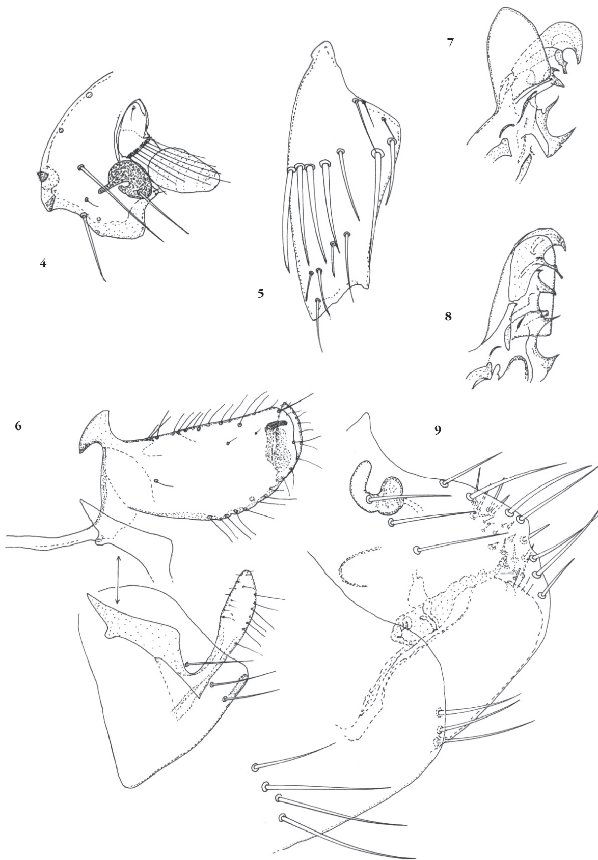
Figures 4-9. – Delostichus degus n. sp. 4 : partie antérieure de la capsule céphalique de l'allotype ; 5 : coxa I d'un mâle paratype ; 6 : holotype, sternite VII et segment IX ; 7 : holotype, apex du phallosome ; 8 : paratype, apex du phallosome ; 9 : allotype, segment VIII, sternite VII, spermathèque.