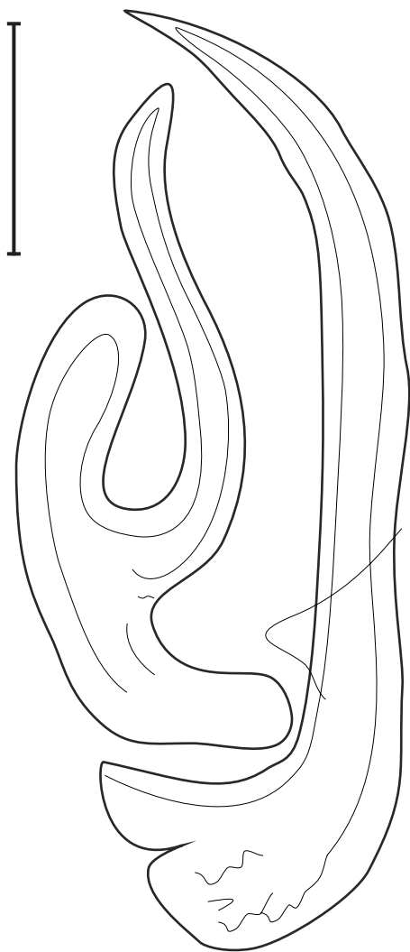
Fig. 3. – Lamellodiscus sanfilippoii n. sp. Morphologie des pièces sclérifiées de l'appareil copulateur mâle. Échelle : 10 µm.

barres latérales dorsales dans le sous-groupe “ergensi” tel que défini par Amine et Euzet (2005). Ce sous-groupe comprend : Lamellodiscus ergensi Euzet et Oliver, 1966, L. kechemirae Amine et Euzet, 2005 et L. tomentosus Amine et Euzet, 2005, tous parasites de Diplodus sargus , et L. baeri Oliver, 1974 parasite de Pagrus pagrus (Linnaeus). Le parasite décrit se distingue de toutes ces espèces par la morphologie des barres dorsales plus larges et nettement plus tourmentées ainsi que par la structure de l'appareil copulateur. Il se rapproche de L. furcillatus Kritsky, Jiménez-Ruiz et Sey, 2000, parasite trouvé chez Diplodus noct (Valenciennes) dans le Golfe Persique, par la morphologie des pièces sclérifiées du haptère.