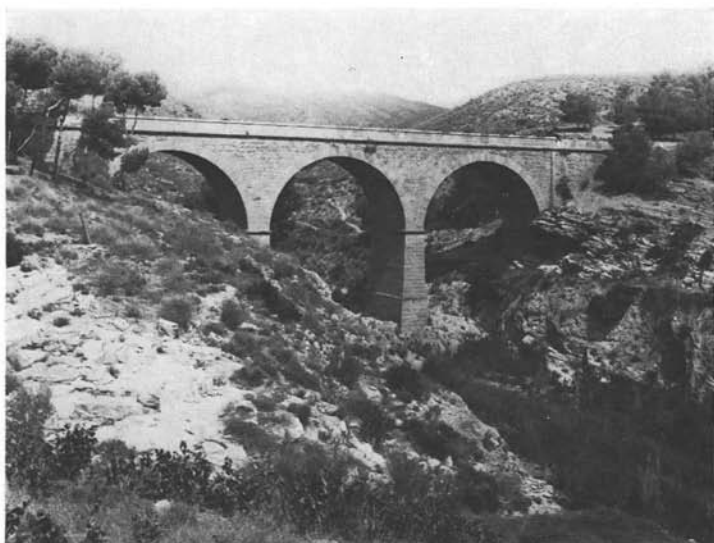
FIG. 1. — Biotope de Phlebotomus chabaudi Croset, Abonnenc et Rioux, 1970 et Phlebotomus alexandri Sinton, 1928. Station PE 35, Rio Jauto, au croisement de la route N 340. Hautes jalaises de calcaire miocène. En bordure des gorges, peuplement de Pinus halepensis ; sur les rochers, groupement à Chamaerops humilis , Thymelaea hirsuta et Stipa tenacissima .