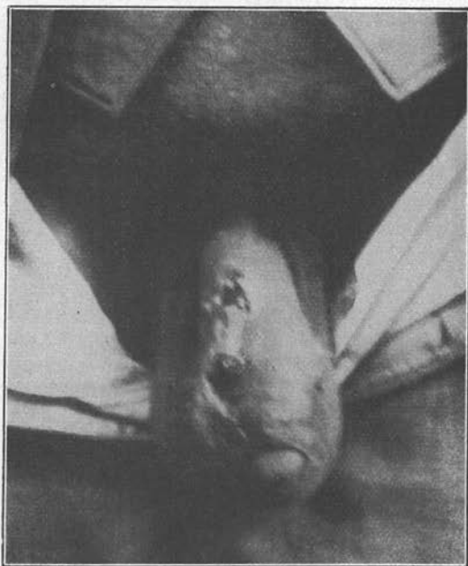
Fig. 1. — Aspect du pénis avec les deux nodules sur la partie dorsale.

Un malade, A. S., 42 ans, métis, Brésilien, agriculteur, habite une propriété rurale. Ses fonctions consistent à surveiller et contrôler les plantations et les récoltes des produits agricoles. Le soir, en ren-