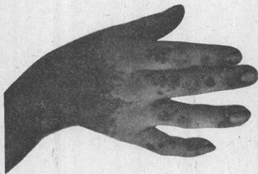
FIG. 1. — Plaques de la « pinta » noire mexicaine de la main et de l'avant-bras.

Origine de la souche. — Nous avons reçu la culture de ce champignon de M. le Prof. Ochoterena (voir note 1, p. 511), qui isole cette souche de la peau d'un homme atteint de « pinta negra » (pinta noire). La photographie reproduite dans la fig. 1 représente l'affection dans la main et le bras. Nous n'avons point reçu d'autres indications, mais M. Ochoterena a isolé aussi un deuxième champignon levuriforme, associé au précédent et qui sera publié prochainement (n° 176).